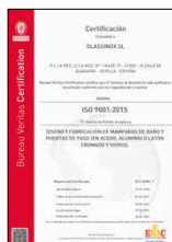
ISO 9001:2015 Sistema de gestión de la calidad