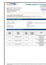
ENSAYOS DE ADHERENCIA Recubrimiento de lacado