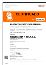
EN 12150-2:2004 Vidrio para la edificación