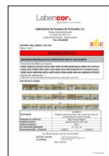
ENSAYOS DE CORROSIÓN Piezas metálicas